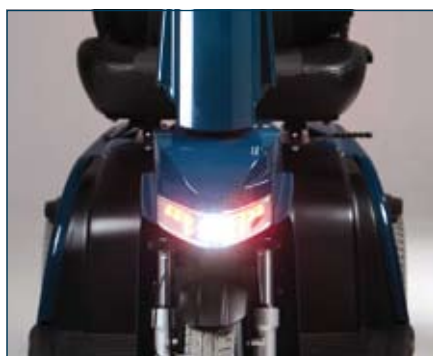
CE märkt LED belysning; fram- & bakljus, blinkers och bromsljus

Till exempel, utöver den ergonomiska hand/tumstryningen (handgas), kan fotgas eller en kombination av båda väljas.