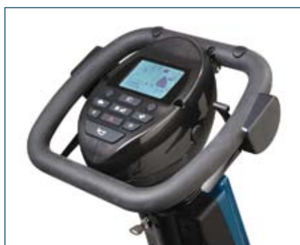
Ergonomisk styrning med en tydlig LCD display och enkla, användarvänliga touchknappar