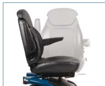
Fullt individanpassat, bekvämt inställbart säte (360° rotation) med bälstöd