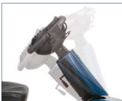
Enkelt, individuellt inställbart styre för god körställning