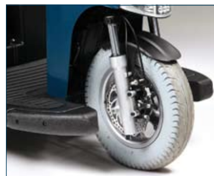
Den främre fjädringen med stötdämpning och skivbromsar ger utmärkt körkomfort