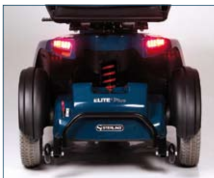
Hydraulisk inställbar bakre fjädring, frikopplingsmekanism och tipskydd